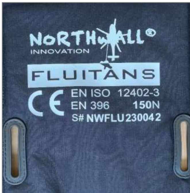
Figur 1.1 – Faksimile av hovedetiketten FLUITANS

På hovedetiketten finnes CE-merket og de tilhørende sertifiseringene.